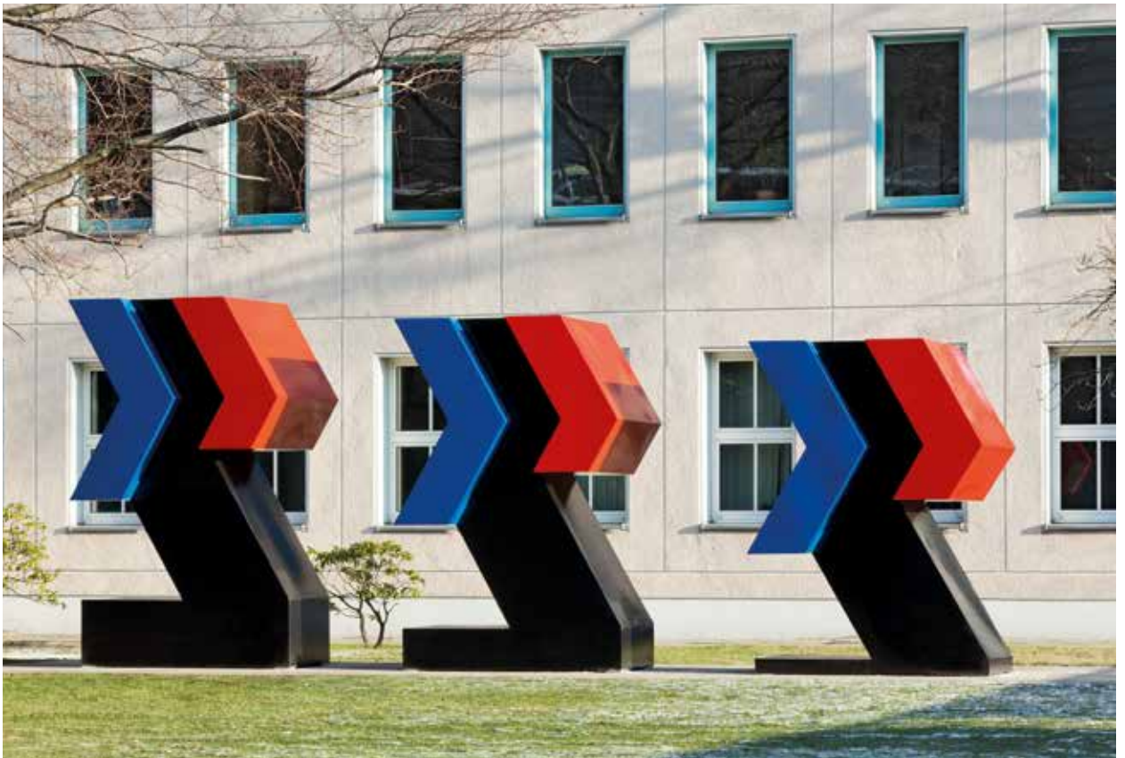
Otto Herbert Hajek, „Zeichen im Stadtraum“, 1980, Bundesamt für Bauwesen und Raumordnung Berlin, nach der Restaurierung 2012

Die Entfernung bzw. Zerstörung bestehender Kunstwerke ist nur in Ausnahmefällen und nur mit Zustimmung der OTI und des Eigentümers (bei Liegenschaften der BImA mit Zustimmung der Zentrale der BImA) zulässig. Im Vorfeld ist durch die Bundesbauverwaltung und den Eigentümer der Liegenschaft zu prüfen, inwieweit andere Lösungen, wie z. B. die Verbringung an einen anderen Standort oder die Weitergabe an andere öffentliche Institutionen (Bundesinstitutionen, Landesinstitutionen, Kommunen) gefunden werden können. Wenn ein Verbleib des Kunstwerks in öffentlichem Eigentum nicht möglich ist, ist die Rückgabe des Kunstwerks an die Künstlerin bzw. den Künstler anzustreben. Die Ergebnisse der Prüfung sind der OTI und dem Eigentümer (bei Liegenschaften der BImA der Zentrale der BImA) zur Zustimmung zuzuleiten.