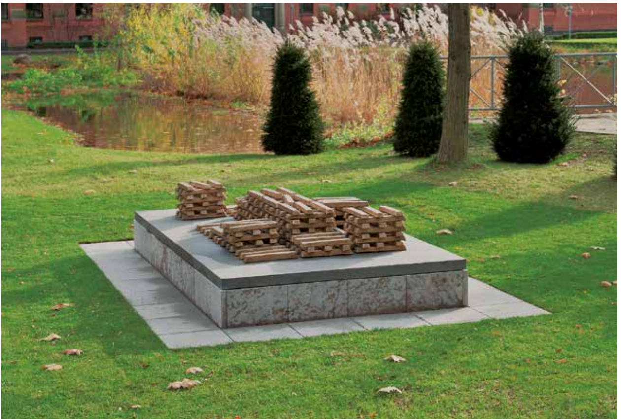
Fritz Balthaus, „Pure Moore“, 2011, Bundeskriminalamt Berlin

Der Unterhalt (Betrieb, Pflege und Instandhaltung) der Kunst am Bau ist Aufgabe und Verantwortung des Eigentümers. Wettbewerbsarbeiten und Angebote der Künstler sollen deshalb zur voraussichtlichen Höhe der Unterhaltskosten und der Lebensdauer ihrer vorgeschlagenen Werke prüffähige Angaben machen bzw. sachdienliche Informationen zur Einschätzung dieser Kosten liefern.