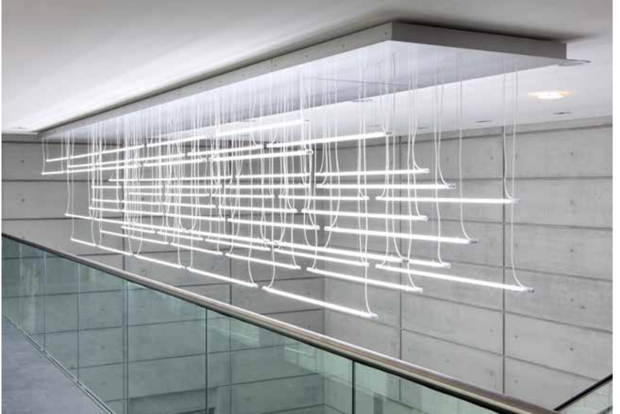
Barbara Trautmann, „Strom“, 2012, Bundesnachrichtendienst Berlin