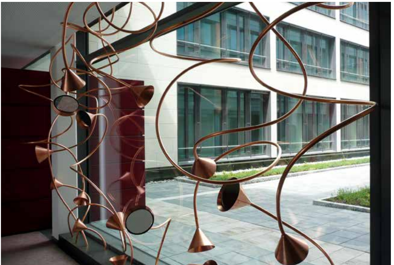
Rebecca Horn, „Sonnenschatten“, 2008, Deutscher Wetterdienst Offenbach

Verfahren zur Vergabe künstlerischer Leistungen sind grundsätzlich von Beginn an fortlaufend zu dokumentieren, so dass die einzelnen Stufen des Verfahrens, die einzelnen Maßnahmen sowie die Begründung der einzelnen Entscheidungen festgehalten werden.