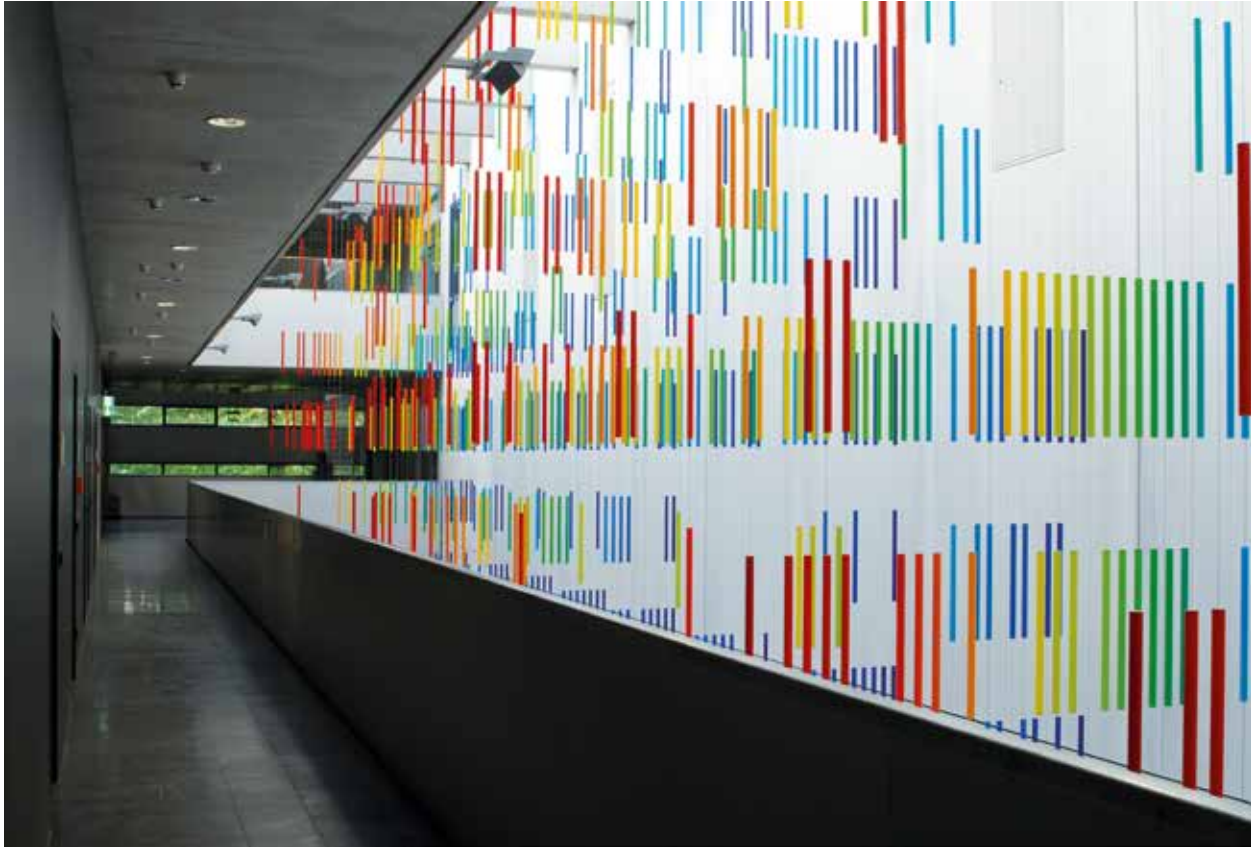
Roland Fuhrmann, „Spektralsymphonie der Elemente“, 2010, Technische Universität Dresden, Neubau der Institute Chemie und Wasserwesen