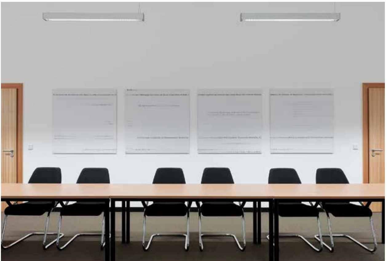
Arnold Dreyblatt, „Inschriften“, 2010, Bundesministerium für Ernährung, Landwirtschaft und Verbraucherschutz Berlin

Die bundesweit tätigen Künstlerverbände, die OTI sowie die Oberste Instanz des Nutzers (Ressort) können jeweils einen Beobachter mit Gaststatus (nicht stimmberechtigt, ohne Anspruch auf eine Aufwandsentschädigung gemäß Ziffer 7.2.) in die Preisgerichtssitzungen entsenden.