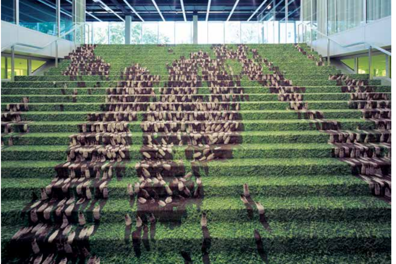
Via Lewandowsky, „Treppenläufer“, 2008, Heinrich-Böll-Stiftung Berlin