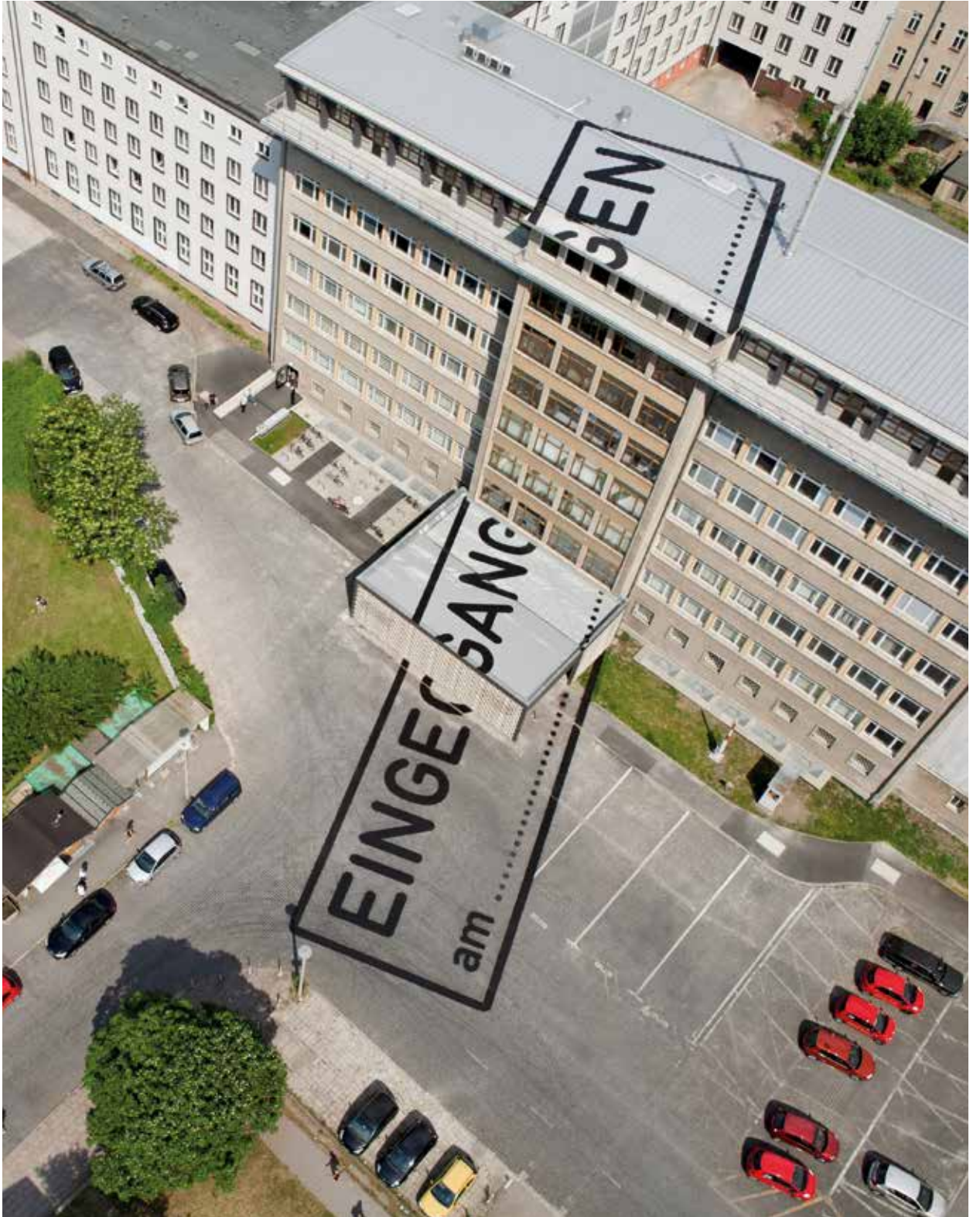
raumlaborberlin (Francesco Apuzzo), „Eingegangen am...“, 2011, Stasimuseum Berlin