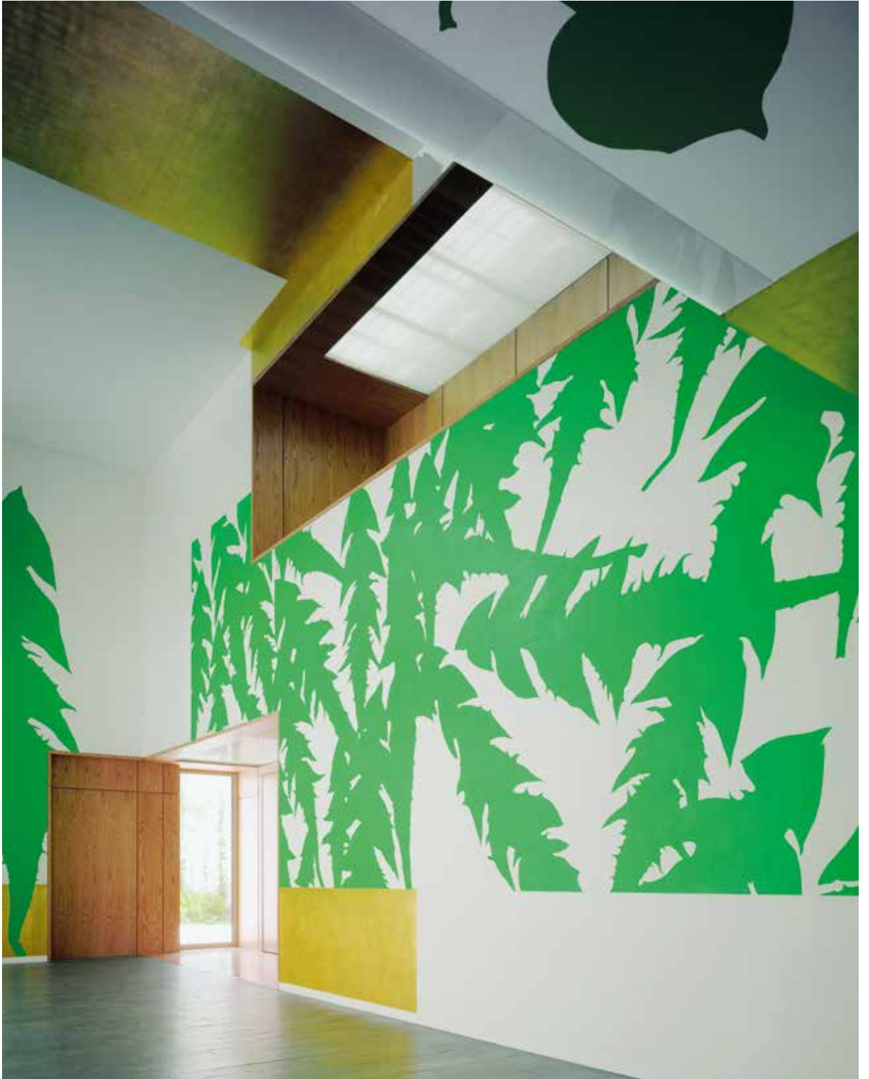
Renate Wolff, „Große Reise“, 2006, Deutsche Botschaft Mexico