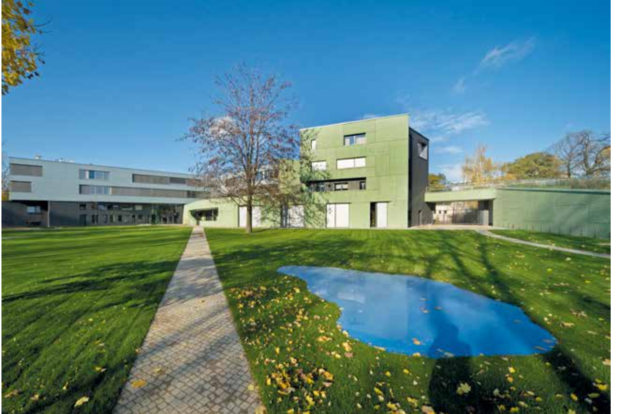
Rainer Splitt, „reflecting pool“, 2007, Deutsche Botschaft Warschau